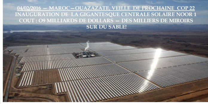
04/02/2016 — MAROC—OUAZAZATE, VEILLE DE PROCHAINE COP 22 INAUGURATION DE LA GIGANTESQUE CENTRALE SOLAIRE NOOR 1 COUT : 09 MILLIARDS DE DOLLARS — DES MILLIERS DE MIROIRS SUR DU SABLE!