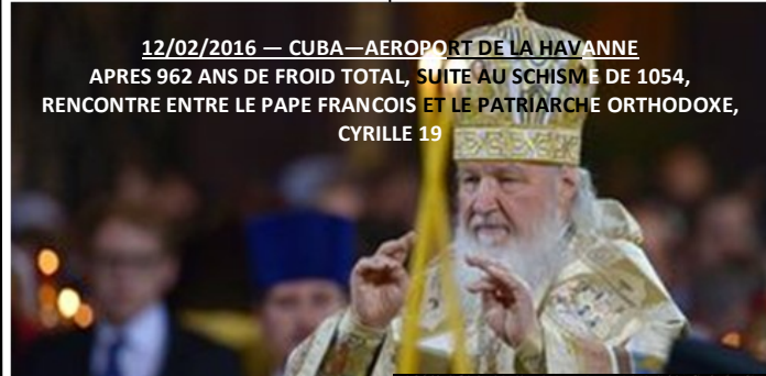
12/02/2016 — CUBA—AEROPORT DE LA HAVANNE APRES 962 ANS DE FROID TOTAL, SUITE AU SCHISME DE 1054, RENCONTRE ENTRE LE PAPE FRANCOIS ET LE PATRIARCHE ORTHODOXE, CYRILLE 19