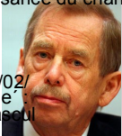
SE VACLAV HAVEL

- mort le 22 mai 1885. 26/02/1928 - Naissance du pianiste de jazz, Antoine 'Fats' Domino. 26/02/1935 - Première démonstration d'un radar. 26/02/1971 - Mort de l'acteur français Fernandel - né le 8 mai 1903. 26/02/1979 - Iran. Fuite du premier Ministre Chapour Bakhtiar. 26/02/1980 - Usa. Attentat du World Trade Center à New York : 6 morts, plus de 1000 blessés. 27/02/1932 - Naissance de l'actrice Elisabeth Taylor - morte le 23/03/2011. 27/02/1933 - Allemagne. Incendie exprès du Reichstag par les nazis qui imputent cet acte aux communistes allemands. 27/02/1958 - L'assurance automobile devient obligatoire en France. 27/02/1982 - Jean-Jacques Annaud reçoit le César du meilleur film pour "la guerre du feu". 27/02/2006 - Marie Humbert et le Dr. Frédéric Duchaussoy obtiennent un non lieu dans le procès d'euthanasie de Vincent Humbert. 27/02/2010 - Chili. Séisme faisant près de 300 morts. 28/02/1798 - Naissance à Chazeaux (hameau proche de St-Sauveur-en-Rue, Loire) d'Etienne Rouchouze, premier vicaire apostolique d'Océanie, Sacré évêque en 1833, il partit évangéliser les îles Sandwich. Il disparut en mer en 1843.