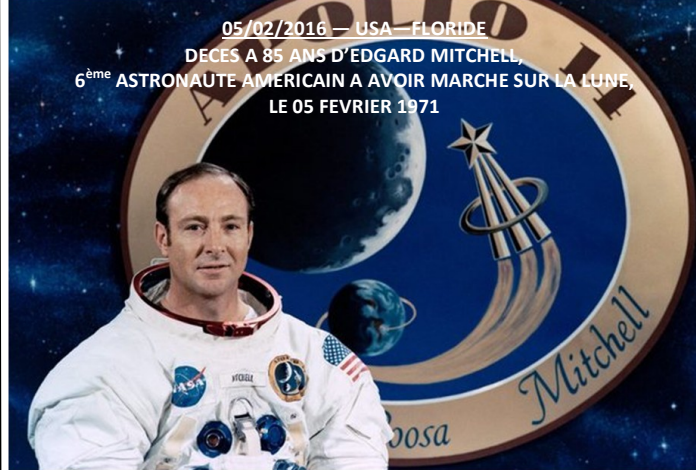
05/02/2016 — USA — FLORIDE DECES A 85 ANS D'EDGARD MITCHELL, 6 eme ASTRONAUTE AMERICAIN A AVOIR MARCHE SUR LA LUNE, LE 05 FEVRIER 1971