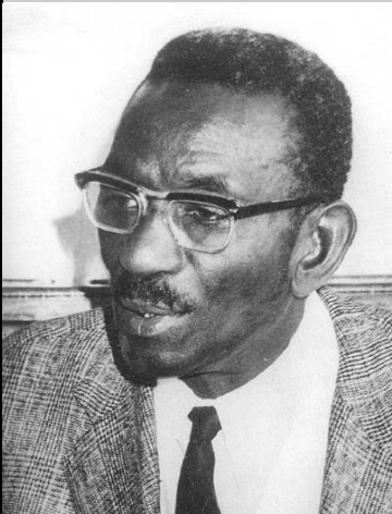
«Ceux qui vivent sont ceux qui luttent; ce sont/Ceux dont un dessin ferme emplit l'âme et le front./Ceux qui, d'un haut destin, gravissent l'âpre cime./Ceux qui marchent, pensifs, épris d'un but sublime». (Victor Hugo, in les Châtiments, 1848).

S eech Anta Jo'ob, en Wolof authentique! Eminent savant dont le nom fit trembler l'Occident! Inscrit en lettres d'or dans les sciences exactes (physique & chimie), humaines (histoire) et sociales (anthropologie)... Auteur rendu célèbre avec son livre notoire, Nations nègres et culture (1954).