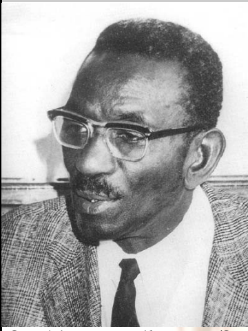
«Ceux qui vivent sont ceux qui luttent; ce sont/Ceux dont un dessein ferme emplit l'âme et le front./Ceux qui, d'un haut destin, gravissent l'âpre cime./Ceux qui marchent, pensifs, épris d'un but sublime». (Victor Hugo, in les Châtiments, 1848).

S ex Anta Jo'ob, en Wolof authentique! Eminent savant dont le nom fit trembler l'Occident! Inscrit en lettres d'or dans les sciences exactes (physique & chimie), humaines (histoire) et sociales (anthropologie)... Auteur rendu célèbre avec son livre notoire, Nations nègres et culture (1954).